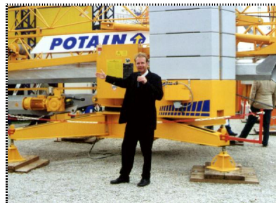
Faszination & Technik