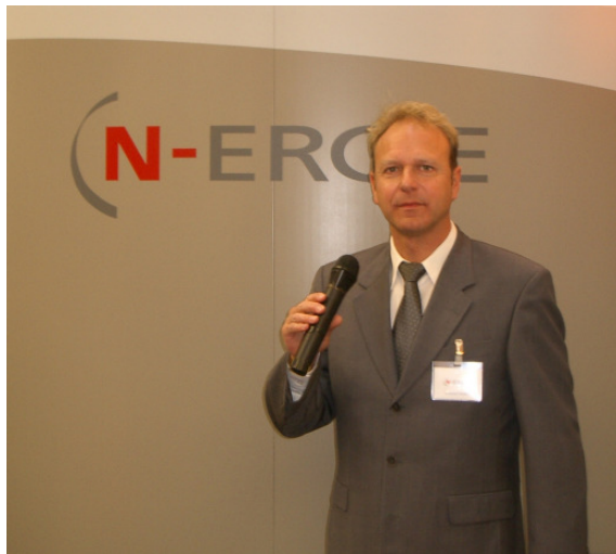
Messtalkshow, Kunde: Energieversorger N-Ergie