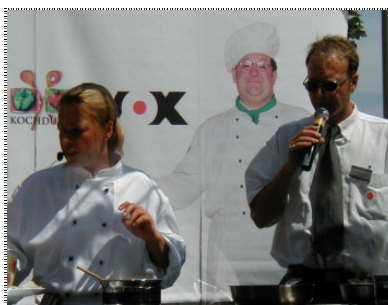
Vox Kochduell on Tour