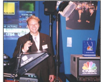
CNBC Business News TV