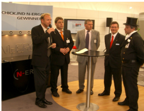
Verband Gebäude- & Energietechnik Messe Frankfurt, ISH