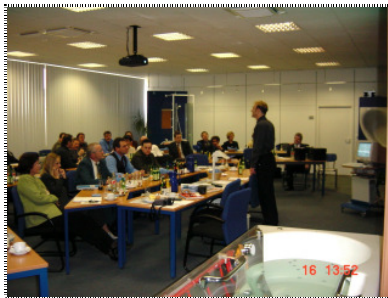
Düker unternehmensintern VK-/Messestraining