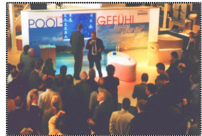
Atmosphäre & Emotion